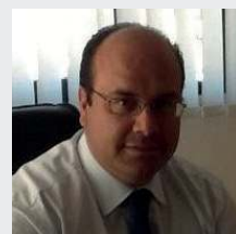
FRANCO MICANTONIO CREDEM EUROMOBILIARE PB